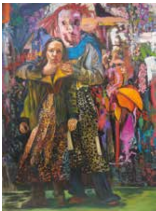
„Selbst“ © Susanne Zagorni: